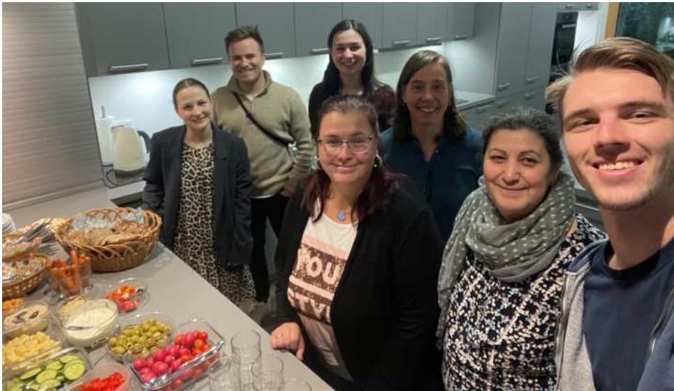
Team des Glaubenskurses