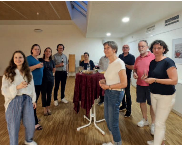
Der Ältestenkreis in der aktuellen Besetzung