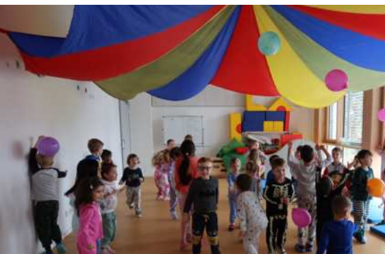
Der Zirkus PEZZETTINO

Wer ist denn schon mal Einrad gefahren? Wer bringt die anderen als Clown zum Lachen? Und wer traut sich in luftiger Höhe über ein Seil zu balancieren? Und haben Sie schon unseren Zirkushund Fanny gesehen?