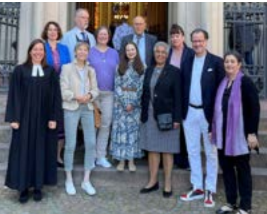
Der Ältestenkreis in der aktuellen Besetzung