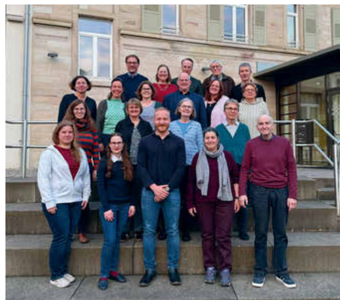
Foto: Ch. Holthof Kirchengemeinderat der ev. Kirchengemeinde Baden-Baden