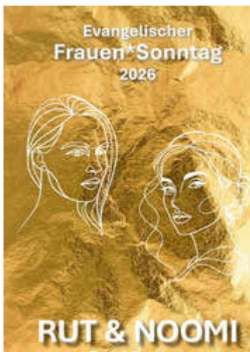
Rut & Noomi

„Wo du hingehst, da will auch ich hingehen“. Diese Worte werden oft als Trauspruch verwendet. Doch diesen Satz sagte Rut zu ihrer Schwiegermutter Noomi. Die Geschichte steht in der Bibel im Buch Rut und handelt von zwei Frauen, die sich gemeinsam auf den Weg machen. Die eine, Noomi, in ihr Heimatland, die andere, Rut, folgt ihr bedingungslos in die Fremde. Beide sind kinderlose Witwen und müssen für sich selbst sorgen.