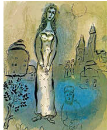
Esther - Marc Chagall © VG Bild-Kunst

20 interessierte Frauen und Männer hörten die spannende Geschichte von Mut und Verweigerung, von Intrigen und Gerechtigkeit.